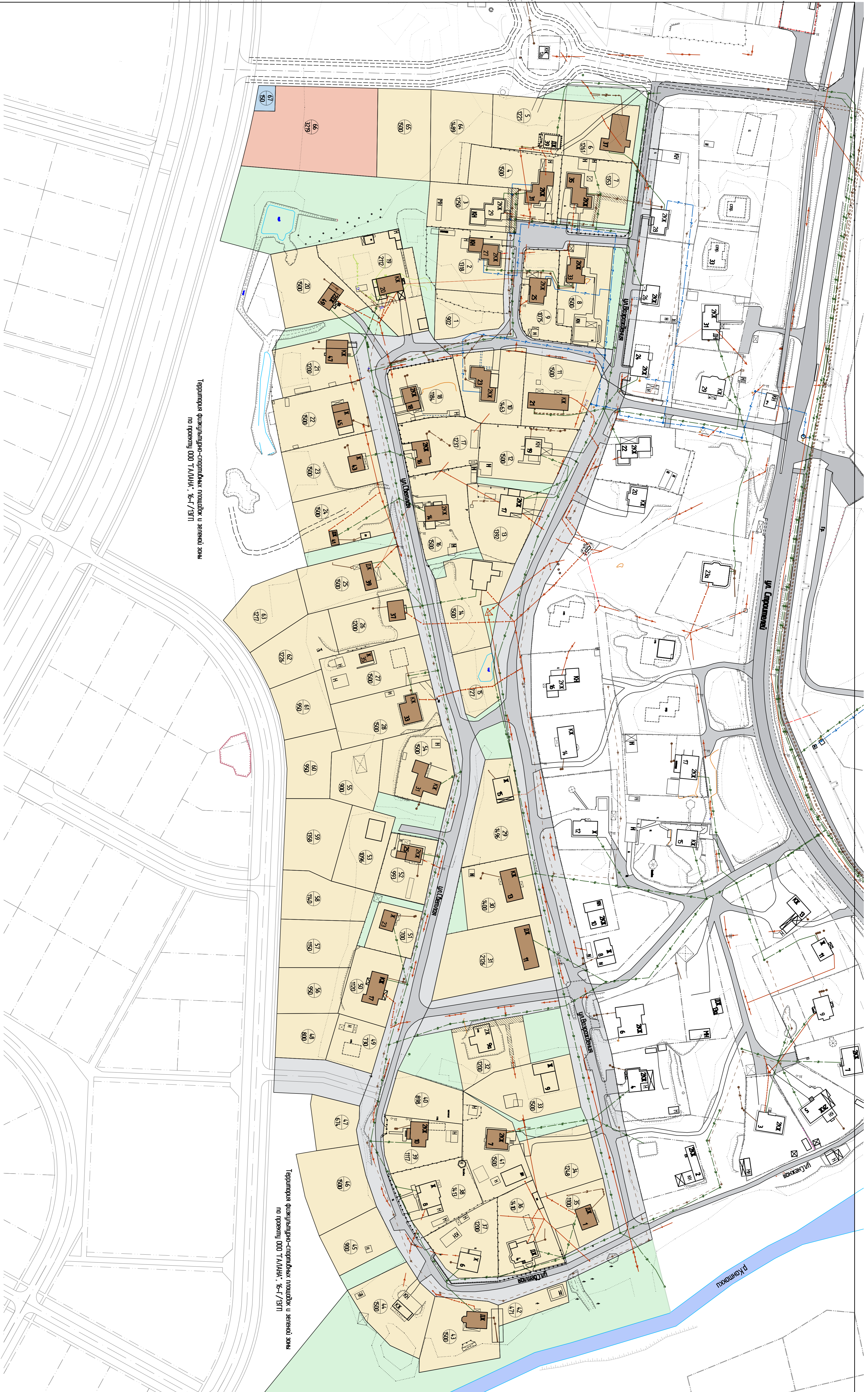
Территория физкультурно-спортивных площадок и зеленой зоны по проекту ООО "АВАНТ", №-Г/191П